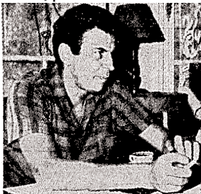
Ο ΜΙΚΗΣ ΘΕΟΔΩΡΑΚΗΣ σε μια πρόσφατη φωτογραφία του

Προσεκλήθη από τους Σοβιετικούς συνθέτας για ανάπαυση στον Καύκασο.