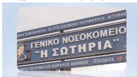
Το Γενικό Νοσοκομείο "Η Σωτηρία" αποτελεί υπόδειγμα σωστής λειτουργίας

Ήδη έχει εγκατασταθεί ένα σύγχρονο ακτινοσκοπικό μηχάνημα και ένα σύγχρονο 2ος Αξονικός Τομογράφος 64 τομών στο τμήμα της Επεμβατικής Ακτινολογίας, ενώ παράλληλα προχωρά η αντικατάσταση της χρήσης ακτινογραφικού φιλμ με ψηφιακή απεικόνιση σε CD, αντιμετωπίζοντας με τον τρόπο αυτό το υπερβολικά μεγάλο κόστος για ακτινογραφικό φιλμ στο Νοσοκομείο μέχρι σήμερα. Συνεχίζονται με πολύ γρήγορους ρυθμούς τα έργα ΕΣΠΑ του εξοπλισμού του Ξενώνα Βραχείας Παραμονής, των Θαλάμων Αρνητικής Πίεσης, της δημιουργίας του Ξενώνα Φιλοξενίας Συγγενών Ασθενών, του Συμβούλου Έργων ΕΣΠΑ και της Προμήθειας Εξοπλισμού για τα νέα ΤΕΠ.