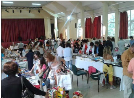
Φωτογραφία από το bazaar του συλλόγου το 2015

Ο σύλλογος αποτελείται από 561 μέλη που συνεργάζονται για τη φροντίδα των νοσηλευόμενων, των συγγενών και των εργαζομένων. Με τη βοήθεια και τη συμμετοχή των μελών, εντός του νοσοκομείου γίνονται και δραστηριότητες όπως ημερίδες για ιατρικά και κοινωνικά θέματα, μαθήματα ζωγραφικής από τον Alessandro De Martino, μαθήματα αγγλικών και ανακύκλωση αλουμινίου, πλαστικού και καπάκια.