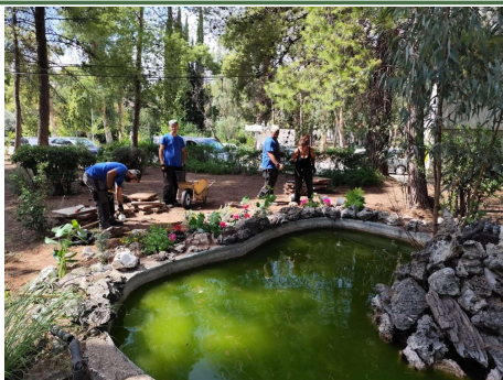
Η λιμνούλα μπροστά στη Σχολή Αδελφών Νοσοκόμων μετά από πολλά χρόνια απέκτησε φροντισμένη όψη και λουλούδια από τους εργαζόμενους ΑΜΕΑ της ΚΟΙΝΣΕΠ ΙΣΙΔΑ ως ανταπόδοση στη Διοίκηση και τους Εργαζόμενους του Νοσοκομείου.

Οι τεχνικές που διδάσκονται από τους Γεωτεχνικούς της ΚΟΙΝΣΕΠ ΙΣΙΔΑ στοχεύουν στη δημιουργία θεραπευτικών κήπων στα νοσοκομεία και την ανάπτυξη της θεραπευτικής κηπουρικής από ευάλωτες ομάδες πολιτών.