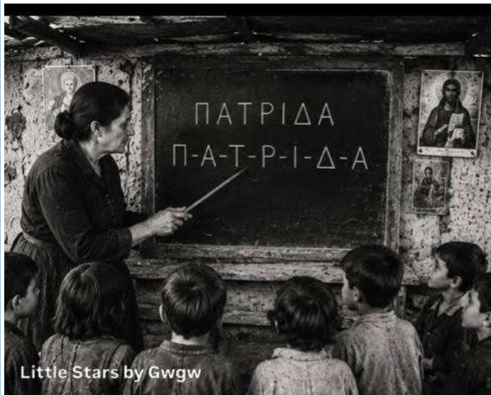
Little Stars by Gwggw

Την έλεγαν Κυρά-Ελένη. Στον Πόντο ήταν δασκάλα στο Παρθενωγείο της Τραπεζούντας. Είχε τελειώσει το Αρσάκειο. Μιλούσε ελληνικά, γαλλικά, και ποντιακά. Στην Ελλάδα έγινε εργάτρια στο καπνομάγαζο. 14 ώρες τη μέρα να διαλέγει φύλλα καπνού. Τα δάχτυλα κίτρινα, τα μάτια θολά από τη σκόνη. Αλλά το βράδυ... το βράδυ γινόταν πάλι δασκάλα.