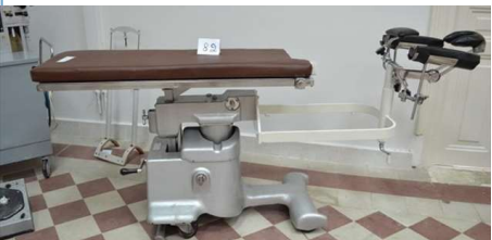
Ιατρικό μηχάνημα Overholt.

Η συνειδητοποίηση της ιστορικότητας του χώρου και της σημασίας των αντικειμένων για την ιστορία της ιατρικής επιστήμης αναφορικά με την εξέλιξη των πνευμονικών νόσων αποτέλεσαν το εφαλτήριο για την προσπάθεια δημιουργίας ενός Μουσείου στο «Σωτηρία» από την «Επιτροπή του Μουσείου Σωτηρία» και από τη Διεύθυνση Νεώτερου Πολιτιστικού Αποθέματος και Άυλης Πολιτιστικής Κληρονομιάς του υπουργείου Πολιτισμού.