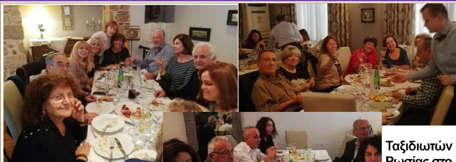
Ταξιδιωτών Ρωσίας στο "Πρεμιέρα"