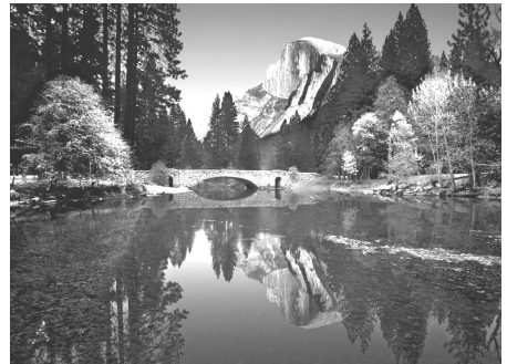
Τάσος Κουλουρίδης Οκτώβριος 2005