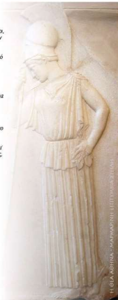
Η ΘΕΑ ΑΘΗΝΑ - ΜΑΡΜΑΡΙΝΗ ΕΠΙΤΑΦΙΑ ΣΤΗΝ

αφού καλά πια θα γνωρίζεις το τι, το πώς και το γιατί, ώστε να μην βρεθείς ούτε ανόητος, ούτε δειλός, μα ούτε και χαμένος.