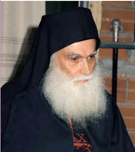
Άγιος Εφραίμ Κατουνακιώτης

Το 1912 γεννήθηκε στη Θήβα. Το 1933 εγκαταστάθηκε στο Άγ. Όρος στην περιοχή "Κατουνακία". Το 1936 χειροτονήθηκε Ιερέας. Το 1959 συνδέθηκε πνευματικά με τον Ιωσήφ τον Ησυχαστή. Το 1998 κοιμήθηκε. Στις 9. 3. 2020 καταγράφηκε στον κατάλογο των Αγίων της Εκκλησίας. Όσοι τον έζησαν τον ονόμασαν: Θεοφώτιστο! Χαριτωμένο! Ευλογημένο! Μακάριο! Ακέραιο! Ακριβο-