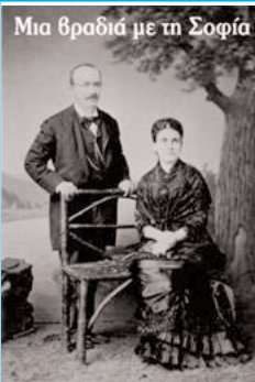
Μια βραδιά με τη Σοφία