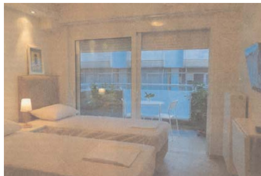
Η διαμονή δεν είναι εντελώς δωρεάν, αφού ασθενείς και συνοδοί καταβάλλουν 10 ευρώ ημερησίως.

"Είναι ψυχοθεραπευτικό. Οι ασθενείς μέσα στον Ξενώνα κάνουν σχέσεις ζωής. Γνωρίζονται μεταξύ τους, συνομιλούν με ανθρώπους που έχουν το ίδιο πρόβλημα και όταν φεύγουν για τον τόπο κατοικίας τους διατηρούν επαφές με τους πρώην συγκατοίκους τους", προσθέτει η κοινωνική λειτουργός υπεύθυνη του Ξενώνα, κ. Πέννυ Λιακοπούλου. Όπως, άλλωστε, επιση-